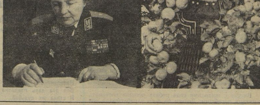
Год 1978 и мы с гордостью называем годом женщин.