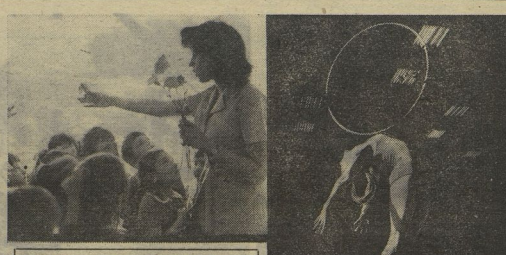
Когда мы посмотрели на эти фотографии болгарских женщин, вспомнили строчки: «Мамы разные нунны, мамы разные мамы».

— Готовясь к своему празднику, радуюсь мировой юбилей, мы помним о той помощи, которую оказали и оказывают нам Советский Союз, другие социалистические страны. Наши пионеры используют все возможности для встреч с советскими людьми, которые приезжают в ДРВ. Как нами, мы отмечаем советские праздники. С большим нетерпением пионеры провинции Бинь Чхепуэ ждут приезда от советских ребят из Бриска, с которыми они ведут переписку. Недавно вьетнамские дети послали в Бриск 37 рисунков — первую выставку. Теперь мы ждём рисунки брисских детей. Мы уверены, что дружба вьетнамских и советских пионеров будет крепнуть с каждым годом мировой юбилей.