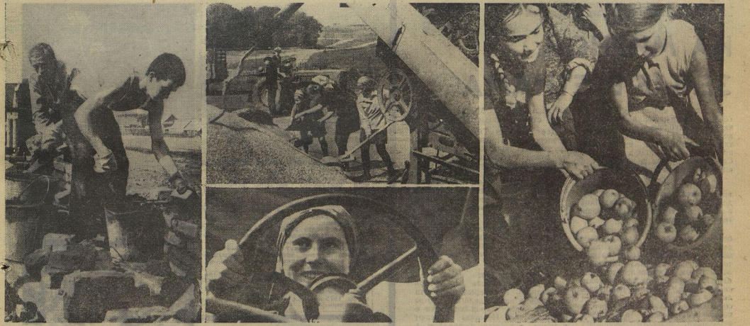
Рис. В. ЕВЛАДЕНКО.

Хабаровский край, Верхнеуральский район, Уральск-2.